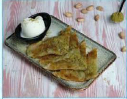
Katmer 380 TL