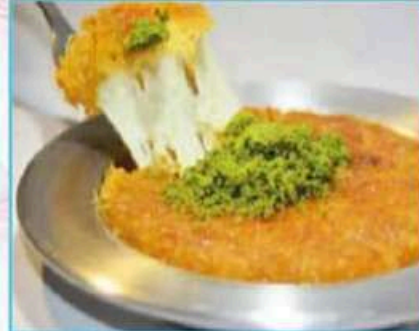
Dondurmalı Künefe 380 TL