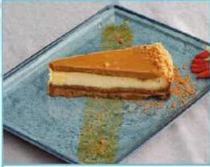
Lotus Cheesecake 350 TL