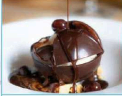
Çikolata Bombası 480 TL