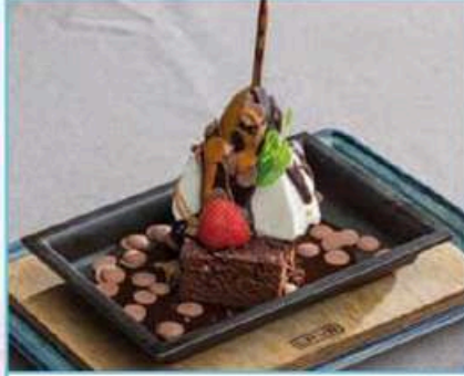
Devils 480 TL