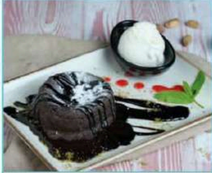
Sufle 360 TL