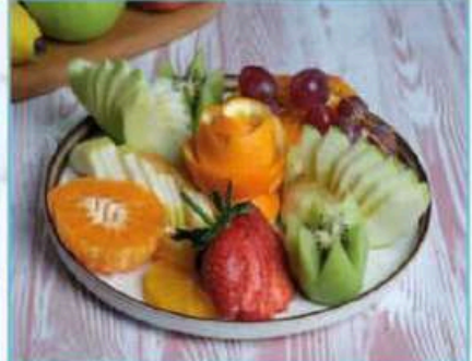
Mevsim Meyve Tabağı 450 TL