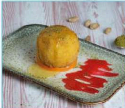
Kızartılmış Dondurma 380 TL