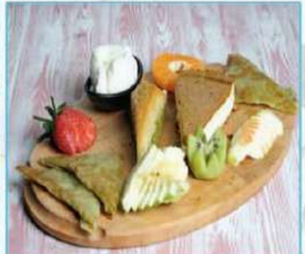
Karışık Tatlı Tabağı 950 TL