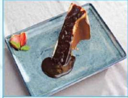
San Sebastian Cheesecake 360 TL