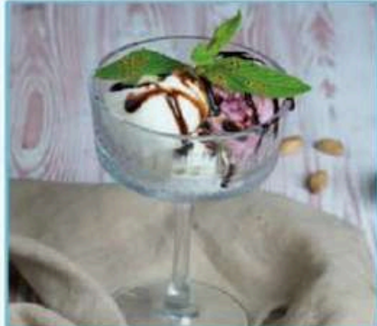
Karışık Dondurma 290 TL