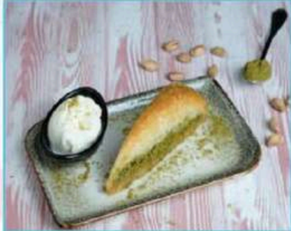
Havuç Dilim Baklava 390 TL