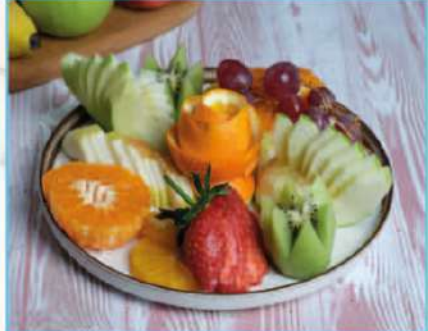
Mevsim Meyve Tabağı 450 TL