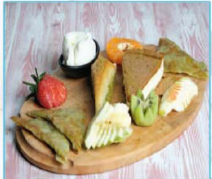
Karışık Tatlı Tabağı 950 TL