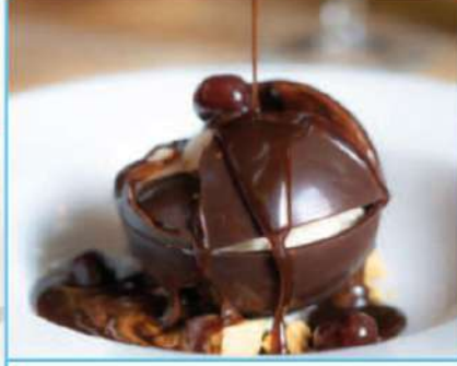
Çikolata Bombası 480 TL