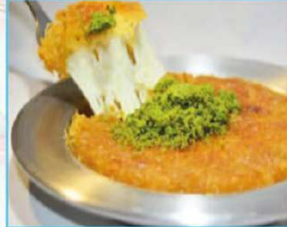
Dondurmalı Künefe 380 TL