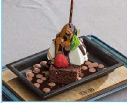
Devils 480 TL