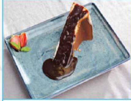
San Sebastian Cheesecake 360 TL