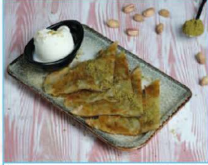
Katmer 380 TL