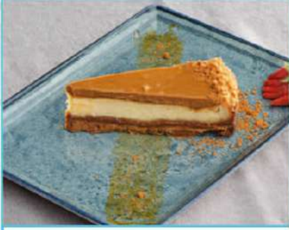
Lotus Cheesecake 350 TL