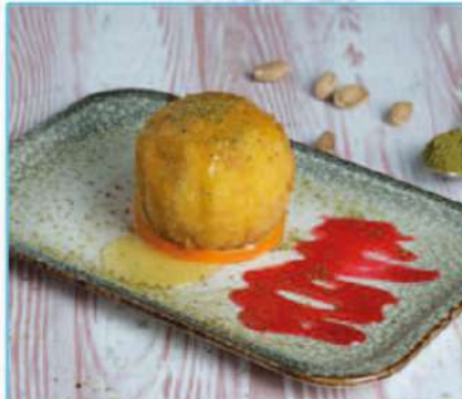
Kızartılmış Dondurma 380 TL