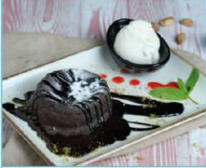
Sufle 360 TL