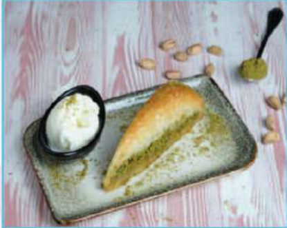
Havuç Dilim Baklava 390 TL