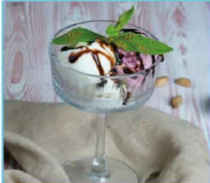
Karışık Dondurma 290 TL