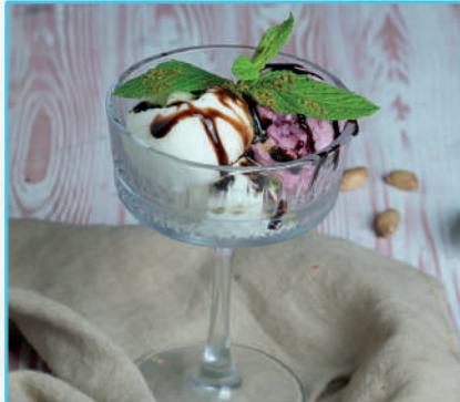
Karışık Dondurma 290 TL