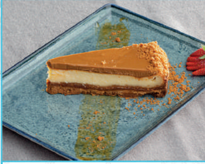
Lotus Cheesecake 290 TL