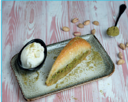
Havuç Dilim Baklava 310 TL