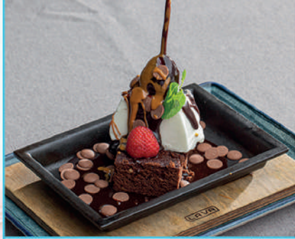
Devils 340 TL