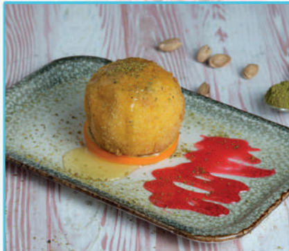
Kızartılmış Dondurma 310 TL