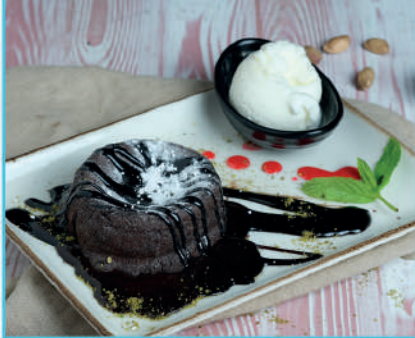
Sufle 310 TL