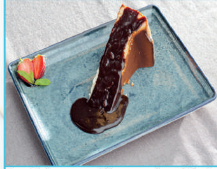
San Sebastian Cheesecake 310 TL