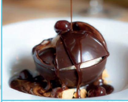
Çikolata Bombası 340 TL