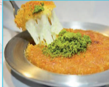
Dondurmalı Künefe 320 TL