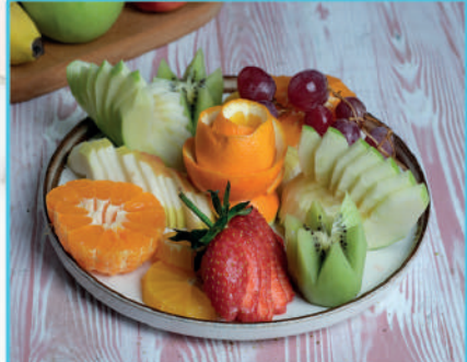
Mevsim Meyve Tabağı 360 TL