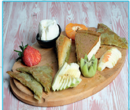
Karışık Tatlı Tabağı 850 TL