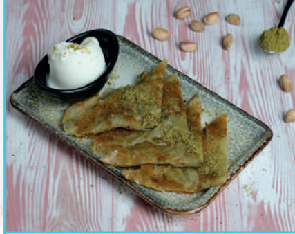
Katmer 320 TL